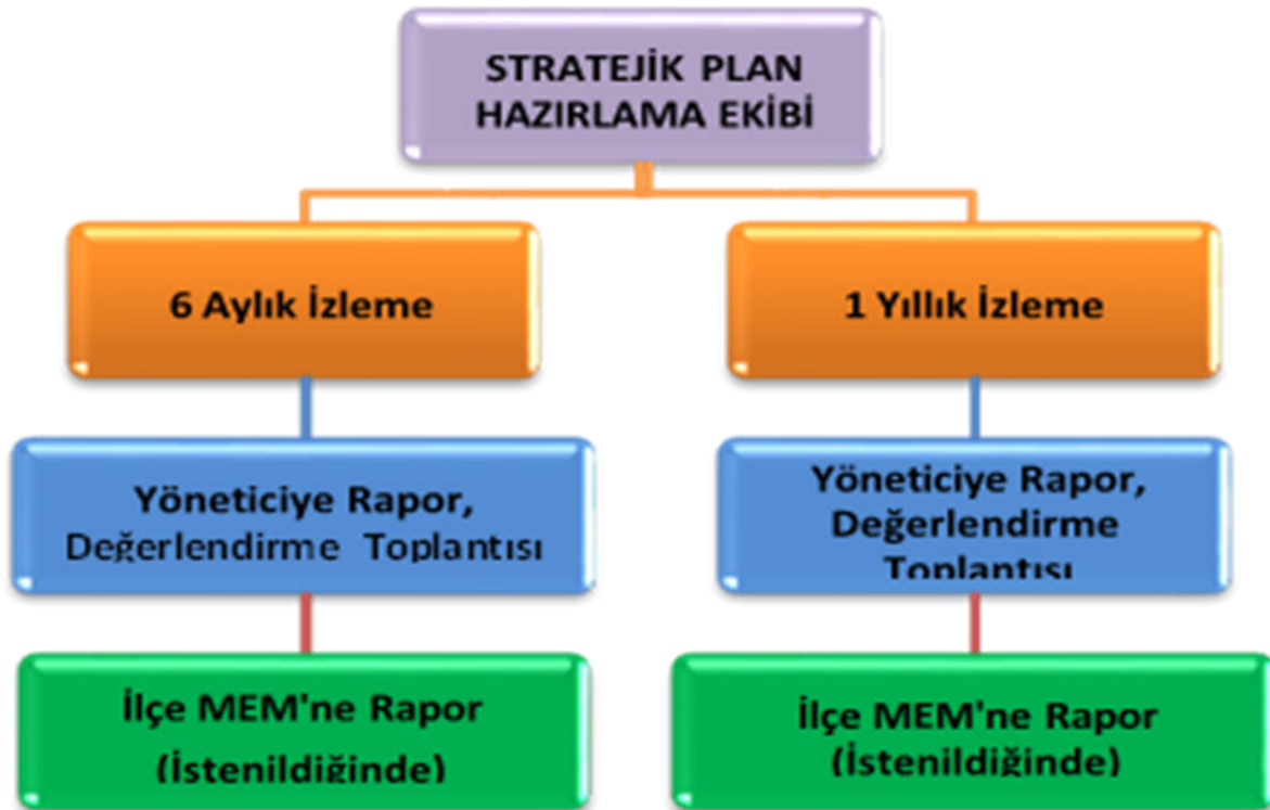
Şekil 3: İzleme ve Değerlendirme Süreci

Müdürlüğümüzün 2019-2023 Stratejik Planı İzleme ve Değerlendirme sürecini ifade eden İzleme ve Değerlendirme Modeli hazırlanmıştır. Müdürlüğümüzün Stratejik Plan İzleme- Değerlendirme çalışmaları eğitim-öğretim yılı çalışma takvimi de dikkate alınarak 6 aylık ve 1 yıllık sürelerde gerçekleştirilecektir. 6 aylık sürelerde rapor hazırlanacak ve değerlendirme toplantısı düzenlenecektir. İzleme-değerlendirme raporu, istenildiğinde İlçe Milli Eğitim Müdürlüğü'ne gönderilecektir. Ayrıca ilçemizin Mülki İdari Amirine sunulacaktır. 1 yıllık izleme-değerlendirme çalışmaları, Stratejik Planımızda yer alan hedeflerin yıllık düzeyde ifade edildiği Performans Programı ve yılsonunda gerçekleşme düzeylerinin belirlendiği Faaliyet Raporu hazırlanarak yapılacaktır.